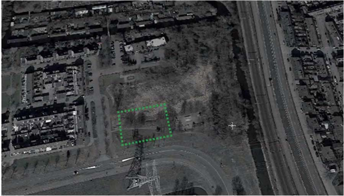
Weiteveen / Houtveldweg